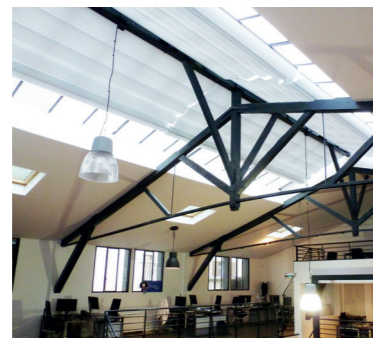
SOCIÉTÉ INFORMATIQUE 75 Paris