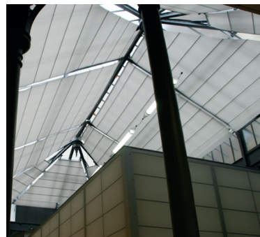
MUSÉE DES PARCHEMINS 75 Paris