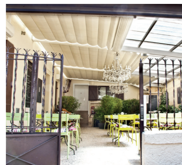
HÔTEL RESTAURANT LE SAINT-JAMES 33 Bouliac