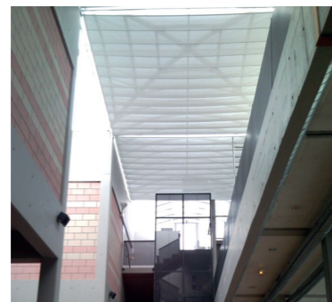
MÉDIATHÈQUE 42 Saint-Chamond