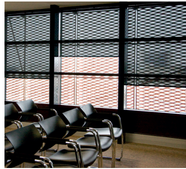
TOUR ELITHIS 21 Dijon