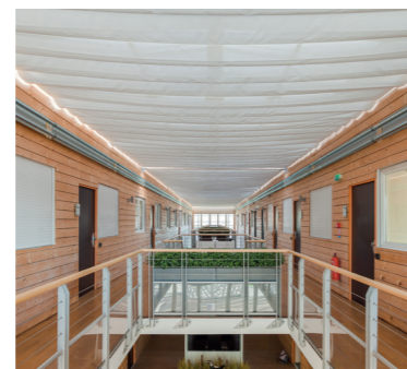
FÉDÉRATION FRANÇAISE DU BÂTIMENT 45 Olivet