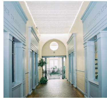
SIÈGE SOCIAL SOGINORPA 62 Bruay-La-Buissière