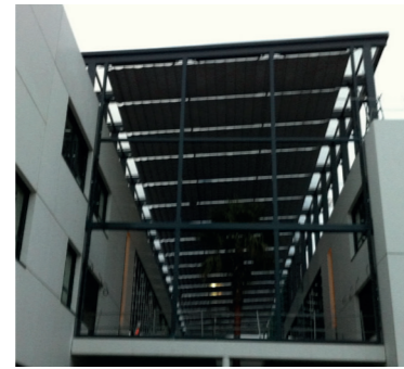
LYCÉE BUFFON 92 Levallois