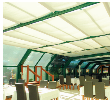
RESTAURANT 74 La Clusaz