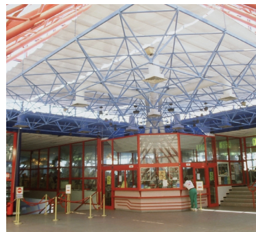
ESPACE LIBERTÉ 11 Narbonne